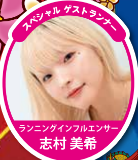
ランニングインフルエンサー 志村 美希